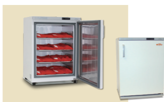
ホットパックセット L