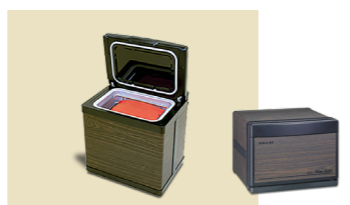
ホットパックセット ミニ(木目)