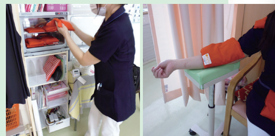
(宮崎県 滝口内科医院様)

トルマリンホットパックなら保温庫から出して、すぐに患者様に当てることができます。天然鉱石による温熱なので低温やけどの心配もほとんどありません。準備や手間も少なく、注射の前に使用することで患者様の苦痛を和らげスピードをアップさせます。