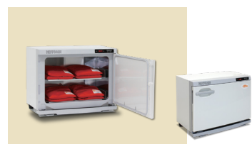
ホットパックセット S