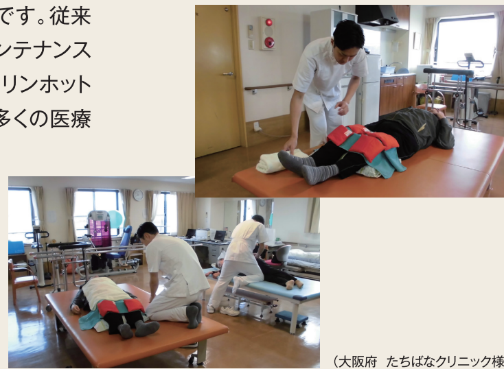
(大阪府 たちばなクリニック様)

トルマリンホットパックなら保温庫から出して、すぐに患者様に当てることができます。コードレスなので、上肢のリハビリテーションを行ないながら下肢に温熱療法を施すことも可能です。業務効率が上がるだけでなく、気持ちいいトルマリンの温熱刺激で患者様満足もアップします。