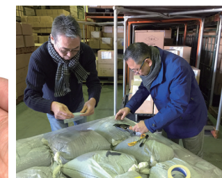
●トルマリン鉱石の検品作業