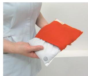
●カバーは着脱可能

トルマリンホットパックは乾式タイプなので、水分もなく日々のメンテナンスが簡単です。利用者様の衣服の上からも使用できるので準備の時間も節約できます。