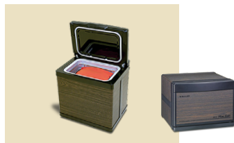
ホットパックセット ミニ(木目)