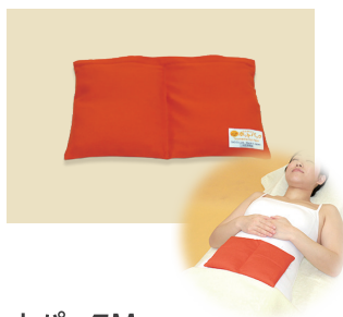
ホットパックM オレンジ(おなか用)