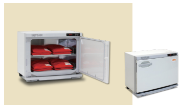
ホットパックセット S