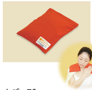
ホットパックS オレンジ(肩・腰用)