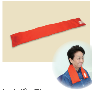
ホットパックL オレンジ(首用)