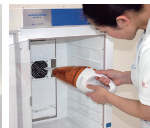
●掃除機によるメンテナンス