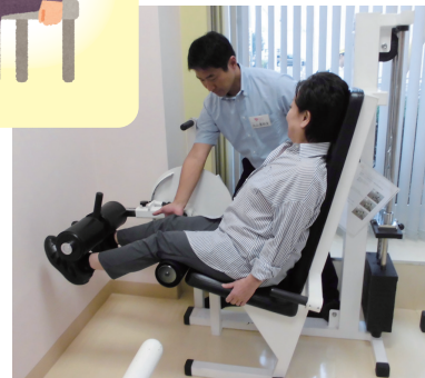
10分ほど温めるだけで血流が改善し、筋肉がほぐれて動きやすくなります。

理学療法の中でも温熱療法は、疼痛の軽減や、可動域の改善など有効な手段の一つとして用いられています。