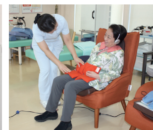
●体のどの部分にもフィット