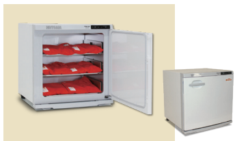
ホットパックセット M