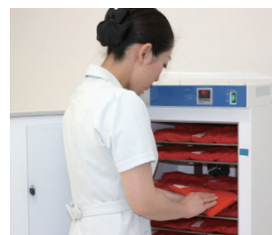
●保温庫で簡単に温められます

装着方法は簡単です。保温庫から出して患部に当てるだけ。新人でも即日対応できます。また、コードレスなので使う場所を問いません。