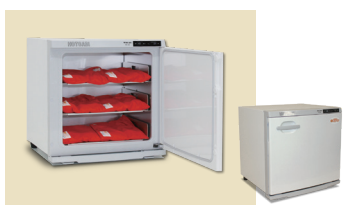
ホットパックセット M