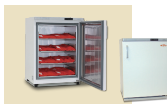
ホットパックセット L