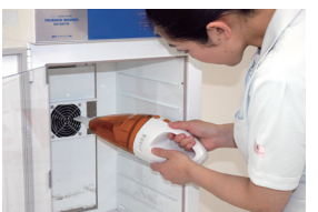
掃除機によるメンテナンス

このローコストを実現するために、高価な鉱石以外にかかるムダなコストや機能を徹底的に省きました。また、乾式タイプで水を使わないので日々のメンテナンスも少なく、ランニングコストも削減できます。