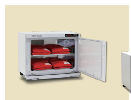
ホットパックセット S