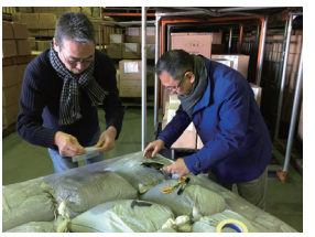
トルマリン鉱石の検品作業