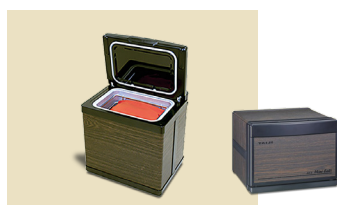
ホットパックセット ミニ(木目)