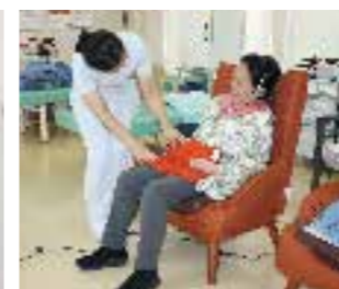
●体のどの部分にもフィット