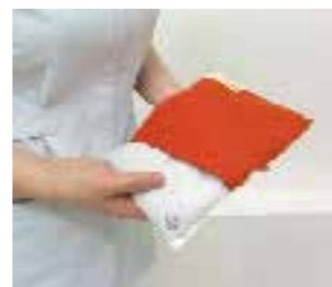
●カバーは着脱可能

トルマリンホットパックは乾式タイプなので、水分もなく日々のメンテナンスが簡単です。利用者様の衣服の上からも使用できるので準備の時間も節約できます。