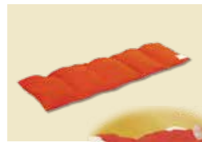
ホットパックS オレンジ(肩・腰用)