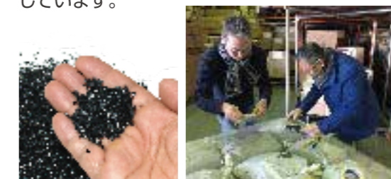
●トルマリン鉱石の検品作業

「体に当てるものだから安心して使いたい」との思いから使用するトルマリン鉱石は品質にこだわりました。天然鉱石100%実現のために質の高いブラクトルマリンをブラジルから直輸入。2~5mm大に粉碎し、検品したものをパック詰めしています。