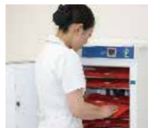
●保温庫で簡単に温められます

装着方法は簡単です。保温庫から出して患部に当てるだけ。新人でも即日対応できます。また、コードレスなので使う場所を問いません。