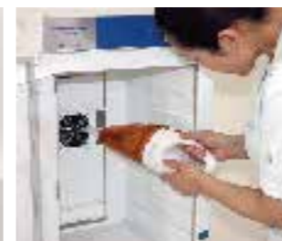
●掃除機によるメンテナンス