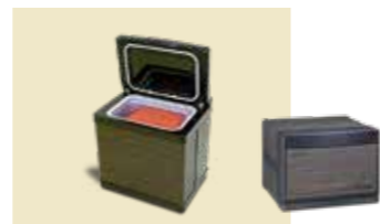
ホットパックセット S